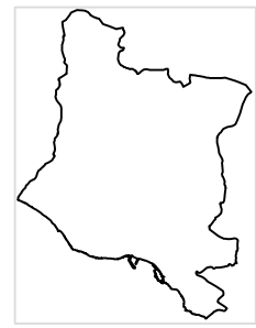
tavola modificata come da Delibera G.M. 91/2015, dai pareri degli Enti sovraordinati, dalla nota della Provincia 257163 / 06 e dalla Commissione VIA-VAS