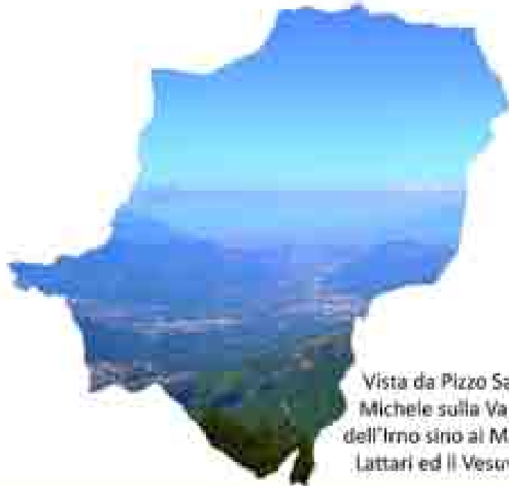
Vista da Pizzo S. Michele sulla Valle dell'Inno sino ai Monti Lattari ed il Vesuvio

Comune di Calvanico (Provincia di Salerno)